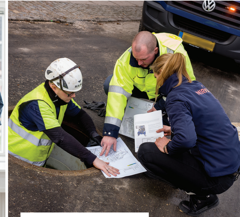
Fordeling af aktivers værdi på elementniveau.