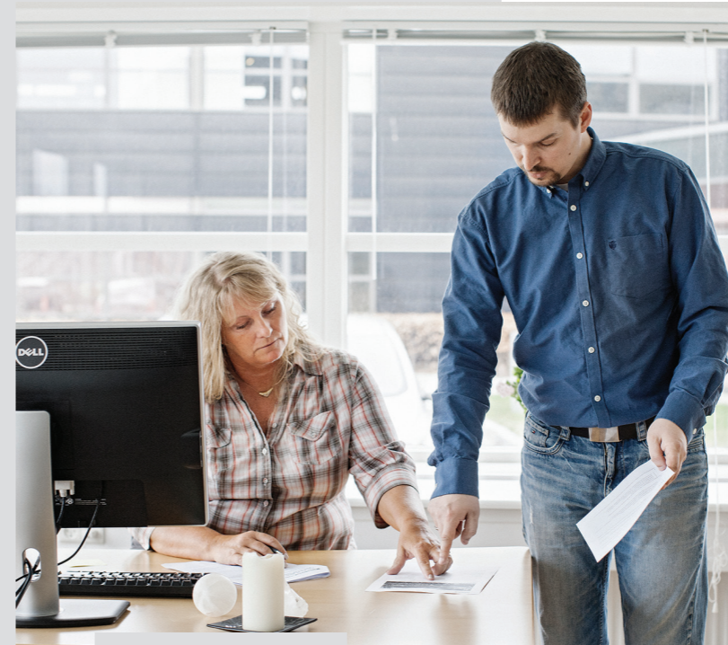
VALUE skaber overblik vha. rapporter og dokumentation

Hurtig adgang til & download af rapporter til dokumentation